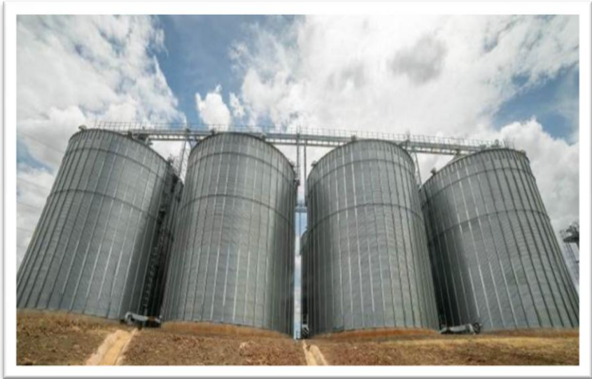
Picha Na. 1: Vihenge vya Wakala wa Taifa wa Hifadhi ya Chakula (NFRA) - Kigoma.