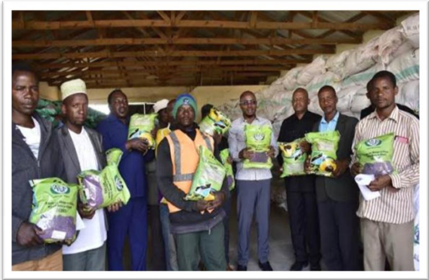
Picha Na.7: Baadhi ya wakulima wa Mkoa wa Singida waliopatiwa mbegu za alizeti kwa ruzuku.

110. Mheshimiwa Spika , Wizara ilipanga kusambaza mbegu na miche bora kwa mpango ruzuku ya mazao kujigharamia yenyewe kupitia Bodi za Mazao. Hadi kufikia Aprili 2023, Bodi ya Pamba Tanzania, imesambaza mbegu za pamba tani 22,146 katika Wilaya 56 kwenye Mikoa 17 inayolima zao la pamba; kupitia Bodi ya Korosho Tanzania imesambaza miche bora ya korosho 11,000 katika Mikoa 13; kupitia Bodi ya Mkonge Tanzania imesambaza miche ya Mkonge 12,633,536 katika Halmashauri za Muheza, Korogwe, Handeni, Kilosa, Mkinga, Singida, Tarime, Bunda, Rorya, Mkuranga, Rufiji, Ruangwa, Bariadi, Shinyanga na Same.