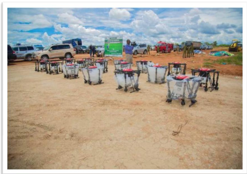
Picha Na.21: Ndege zisizo na rubani (drones) zilizonunuliwa na Bodi ya Pamba zitakazotumika katika unyunyuziaji wa viuatilifu katika mashamba ya pamba.

ili kurahisisha udhibiti wa visumbufu vya zao la pamba.