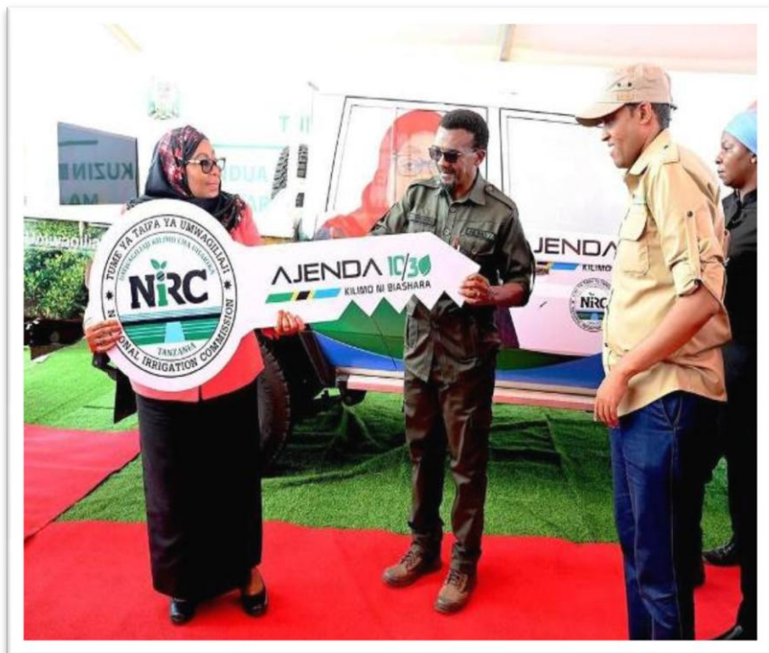
Picha Na.2: Rais wa Jamhuri ya Muungano wa Tanzania Mhe. Dkt. Samia Suluhu Hassan akimkabidhi funguo Mkurugenzi Mkuu wa Tume ya Taifa ya Umwagiliaji Bw. Raymond W. Mndolwa

67. Mheshimiwa Spika , Tume imenunua magari 53 sawa na asilimia 139.5 ya lengo kwa thamani ya Shilingi 8,338,859,725 kwa ajili ya kuimarisha usimamizi wa shughuli za umwagiliaji kupitia ofisi za umwagiliaji za Wilaya; na imenunua mitambo 15 sawa na asilimia 125 ya lengo na magari makubwa (heavy trucks) 17 kwa thamani ya Shilingi 15,603,742,179 kwa ajili ya ujenzi na ukarabati wa miundombinu ya umwagiliaji. Taratibu za manunuzi ya vifaa vya upimaji (land survey equipment) zinaendelea.