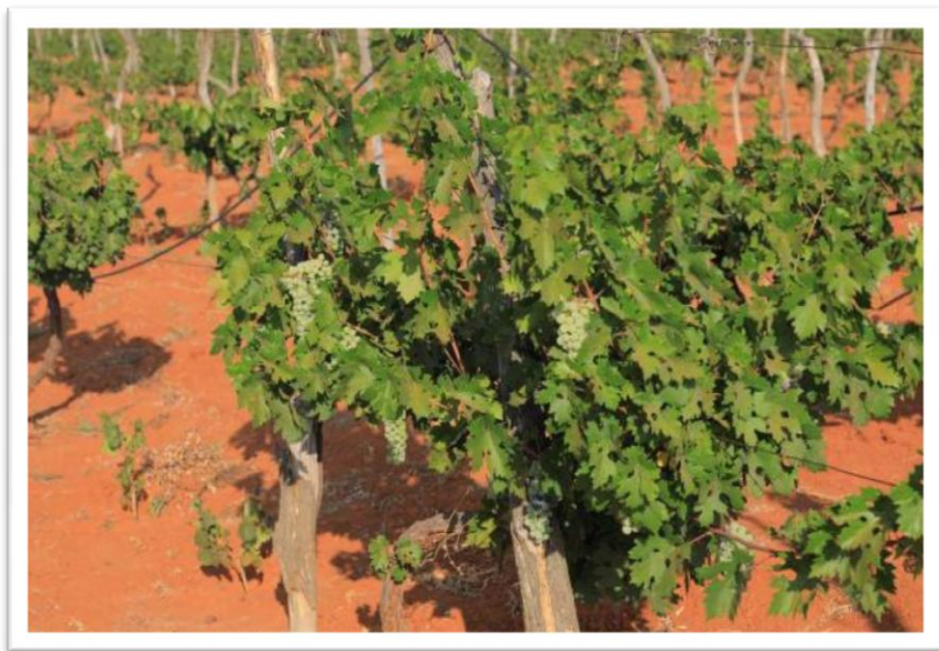
Picha Na.23: Shamba la zabibu (block farm) lililopo Chinangali-Dodoma

227. Mheshimiwa Spika , uzalishaji wa zao la zabibu umeongezeka kutoka tani 13,754 mwaka 2020/2021 hadi tani 15,513 mwaka 2021/2022. Uzalishaji huo umetokana na kuimarika kwa matumizi ya pembejeo za kilimo, zana za kilimo na huduma bora za ugani. Aidha, hekta 240.8 za shamba la Chinangali II zimeendelezwa kwa ajili ya uanzishwaji wa mashamba makubwa ya pamoja (Block Farming). Vilevile, katika kuimarisha masoko na kupunguza upotevu wa zao la zabibu, Wizara imeanza ujenzi wa kiwanda cha kusindika zabibu katika Wilaya ya Chamwino.