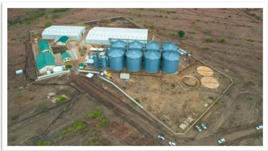
Picha Na.14: Vihenge vya kisasa na ghala ya kuhifadhia Nafaka vilivyo jengwa Babati - Manyara