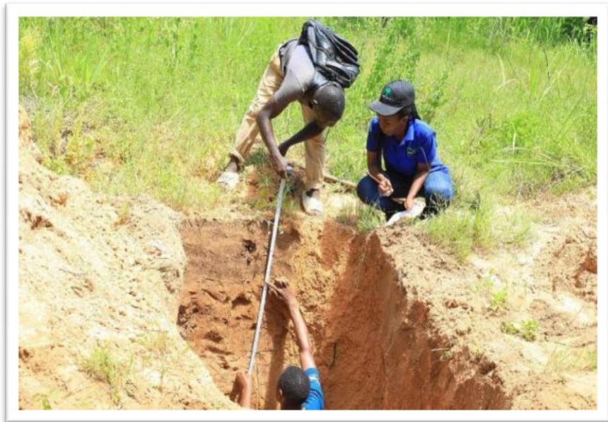
Picha Na.9: Wataalam wa Wizara ya Kilimo wakichukua sampuli za udongo (Soil Profile) katika Halmashauri ya Kigoma.

zimechukuliwa katika mashamba hayo kwa ajili ya kupima afya ya udongo. Matokeo ya vipimo yatatumika kutoa ushauri wa mazao stahiki na matumizi sahihi ya mbolea.