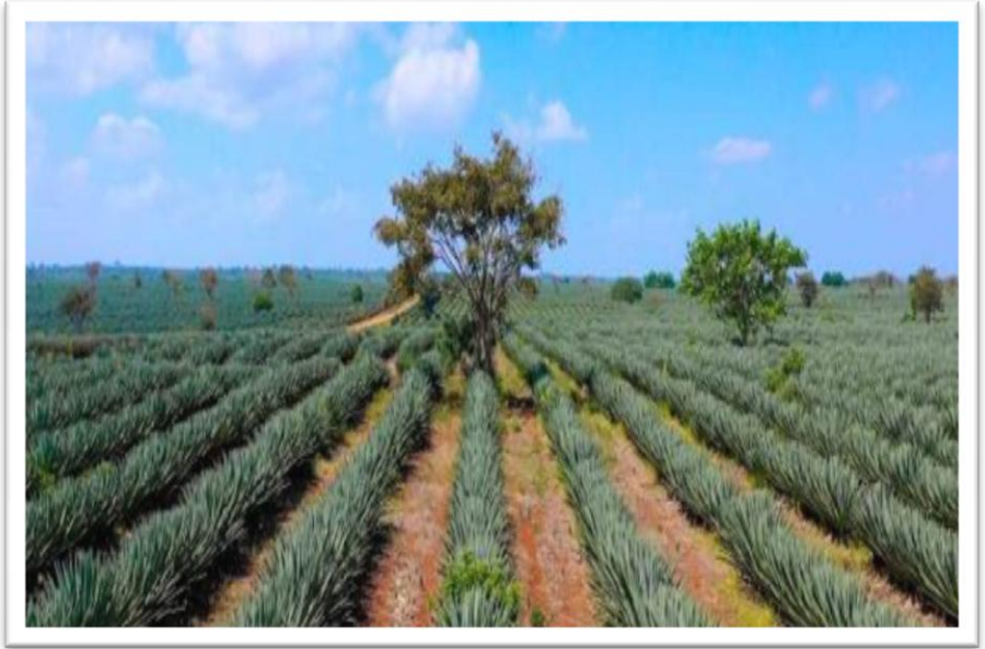
Picha Na.18: Shamba la Mkonge lililoendelezwa Kingolwira – Morogoro