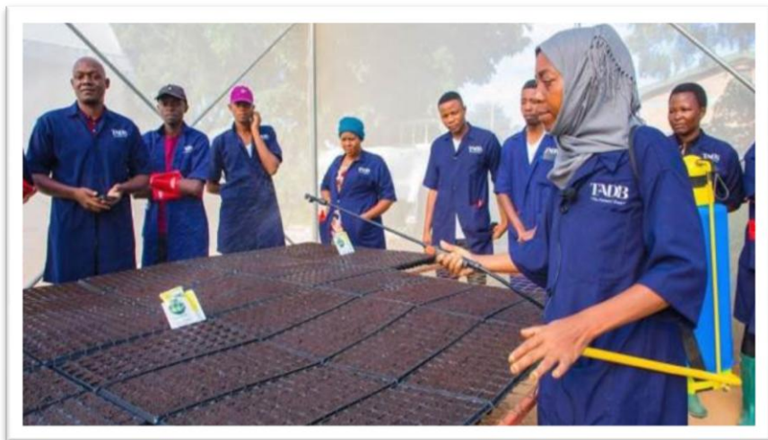
Picha Na. 17: Vijana wakipatiwa mafunzo ya uzalishaji wa miche katika kituo Atamizi cha Bihawana Mkoa wa Dodoma kupitia Programu ya Jenga Kesho iliyo Bora (BBT).

175. Aidha, Wizara imekamilisha taratibu za uchambuzi ambapo vijana 812 wamekidhi vigezo vya kupata mafunzo ya kilimo biashara katika awamu ya kwanza. Kati ya hao, wanawake ni 282 na wanaume 530. Pia, vijana hao wamewasili katika vituo atamizi 13 na mafunzo yanaendelea. Mafunzo hayo yanatolewa kwa kipindi cha miezi minne (4) na yatakamilika Agosti 2023 ambapo uchambuzi wa kundi la pili na tatu unaendelea. Baada ya kuhitimu mafunzo hayo, vijana na wanawake hao watapatiwa mashamba yenye ukubwa usiozidi ekari 10 kulingana na aina ya mazao. Mashamba hayo watakayopewa watapewa umiliki (sub leasing) kwa miaka 66 na kumilikishwa ardhi.