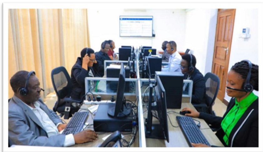
Picha Na.10: Wataalam wa Wizara wakitekeleza majukumu yao ndani ya Kituo cha Huduma kwa Wateja (Call Center)

121. Mheshimiwa Spika , Wizara imeendelea kuimarisha huduma za ugani nchini kwa kuboresha mazingira ya utoaji huduma hizo kwa wakulima. Hadi kufikia Aprili 2023, Wizara imenunua na kusambaza samani (viti 1,020 na meza 23) katika katika Vituo vitano (5) vya Rasilimali za Kilimo vya Kata (WARCs) katika mikoa ya Dodoma, Singida na Simiyu. Vilevile, Wizara imesambaza matrekta madogo (powertiller) 11 katika WARCs za Mikoa ya Dodoma, Morogoro, Singida, Iringa, Mwanza, Geita, Lindi, Songwe na Mbeya.