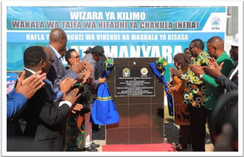
Picha Na.13: Uzinduzi wa Vihenge vya Kisasa na ghala ya kuhifadhia Nafaka Mkoani Manyara-Babati.