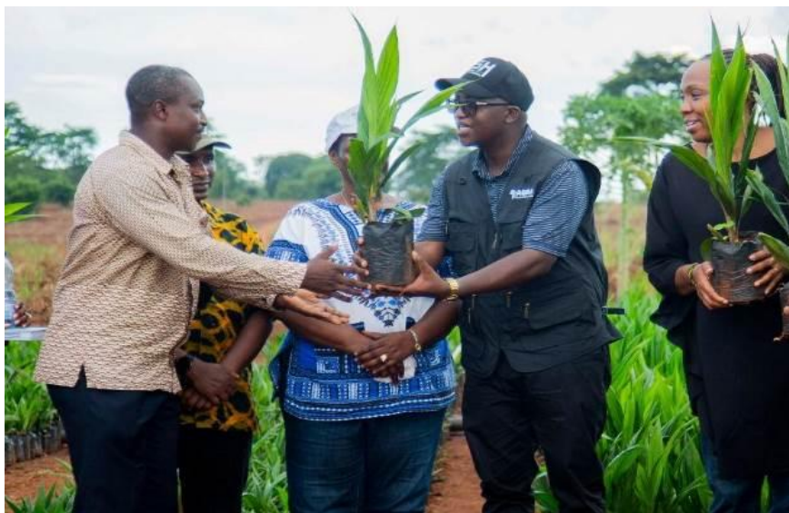
Picha Na. 6: Naibu Waziri wa Kilimo Mhe. Anthony Mavunde akigawa miche ya chikichi ya Wakala wa Mbegu Tanzania (ASA) kwa wakulima wa chikichi Mwele - Tanga

109. Kadhalika, TARI imesambaza miche bora ya chikichi 764,313 katika Mikoa ya Kigoma, Mtwara, Mbeya, Kagera, Katavi na Tanga. Pia, miche ya zabibu 210,523 imezalishwa ambapo miche 98,815 imesambazwa kwa wakulima katika Wilaya za Chamwino, Mpwapwa, Dodoma Jiji na Kondoa na usambazaji unaendelea. Miche hiyo inatosheleza kupandwa katika eneo lenye ukubwa wa ekari 197.25.