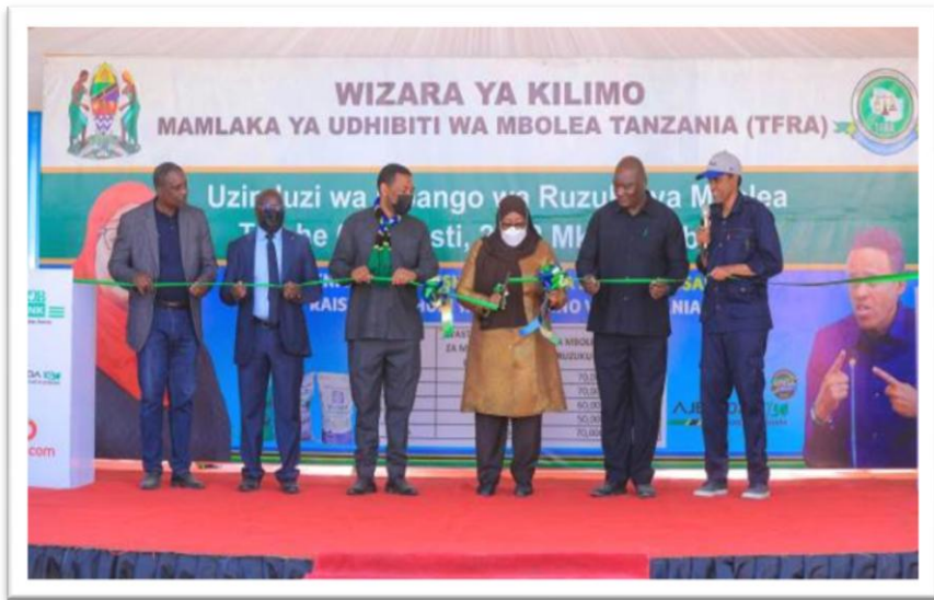
Picha Na.8: Rais wa Jamhuri ya Muungano wa Tanzania Mhe. Samia Suluhu Hassan akizindua Mpango wa Ruzuku ya Mbolea wakati wa Maadhimisho ya Sikukuu ya Wakulima Nanenane yaliyofanyika katika viwanja vya John Mwakangale Mkoa wa Mbeya

ya mbolea ili kuhakikisha usambazaji wa mbolea unafanikiwa.