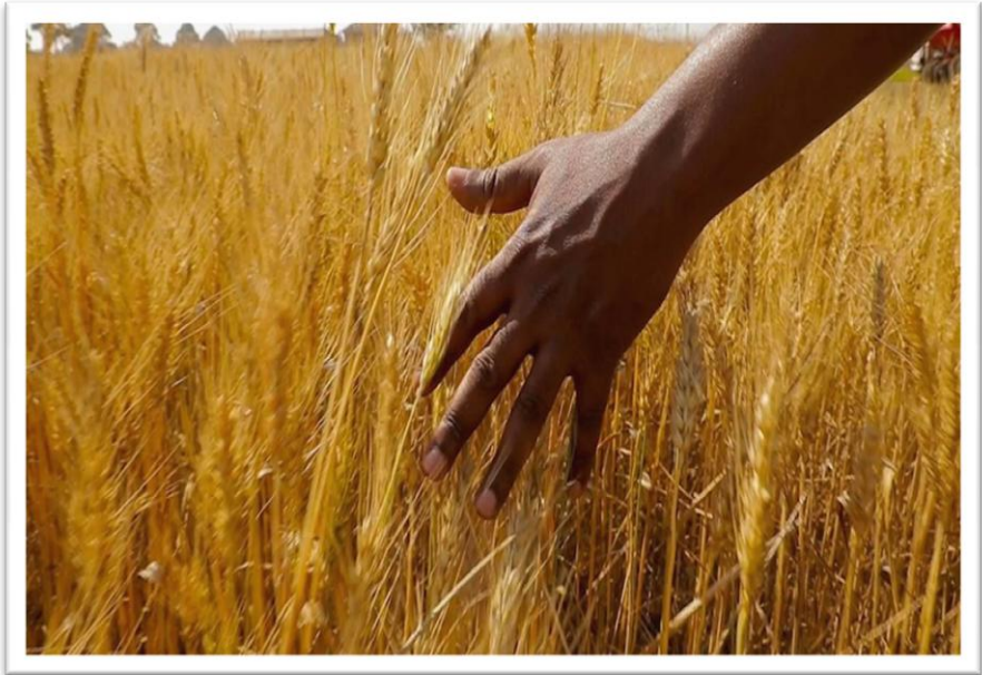
Picha Na.22: Shamba la zao la ngano lililopo Basuto – Manyara