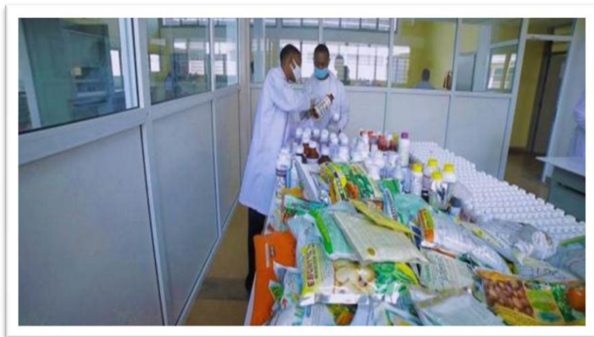
Picha Na.4: Maabara maalum inayosimamiwa na Mamlaka ya TPHPA kwa ajili ya uhakiki wa viuatilifu kabla ya kwenda kutumika mashambani

97. Mheshimiwa Spika , ili kuimarisha upatikanaji wa viuatilifu vyenye ubora, TPHPA imekagua jumla ya maduka 314 katika Mikoa ya Tabora (54), Shinyanga (26), Geita (41), Mwanza (60), Simiyu (32), Mara (28), Dar es Salaam (10), Morogoro (8), Mbeya (4), Ruvuma (1), Iringa (35) na Songwe (15) ili kudhibiti uwepo wa viuatilifu visivyona ubora.