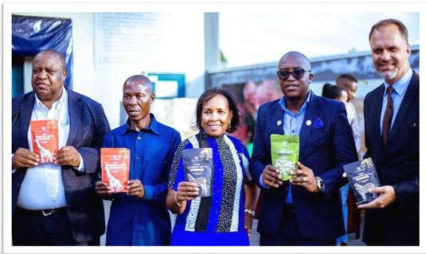
Picha Na. 11: Naibu Waziri wa Kilimo Mhe. Anthony Mavunde akiwa na wadau wa kilimo wakiwa wameshika pakiti za korosho iliyowekwa chapa ya Tanzania

136. Wizara kwa kushirikiana na Sekta binafsi imewezesha uwekaji wa chapa (branding) kwenye mazao mbalimbali ikiwemo korosho zinazobanguliwa na parachichi na kuuzwa nje ya nchi ili kuyatambulisha na kuyatofautisha na mazao yanayozalishwa nchi nyingine. Aidha, Wizara inaendelea na jitihada za uwekaji chapa kwenye mazao mengine yanayosafirishwa nje ya nchi.