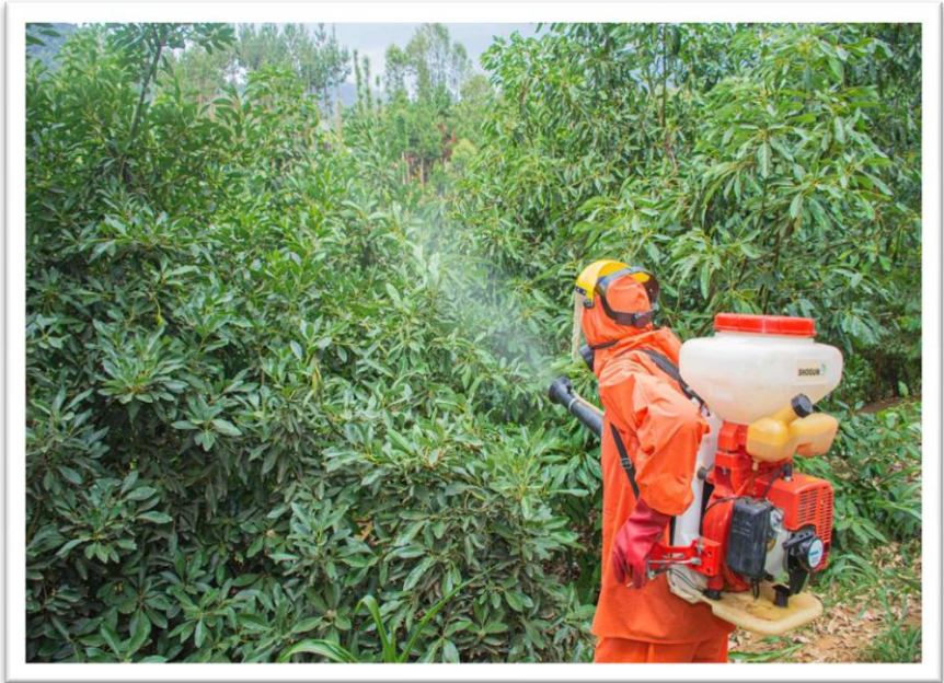
Picha Na. 5: Udhhibiti wa visumbufu katika zao la parachichi

100. Mheshimiwa Spika, Mamlaka imesajili viuatilifu vipya 160 kwa ajili ya matumizi nchini na imetoa vibali 19 vya kuingiza viuatilifu nchini na hati 125 za usajili wa viuatilifu. Pia, imechambua ubora wa viuatilifu 407 ambapo vyote vilikuwa salama na vyenye ubora na kukagua shehena 791 za mimea zilizokuwa zinaingia nchini na kubaini visumbufu 39 vya kikarantini ambapo mimea hiyo imewekwa kwenye karantini kwa ajili ya uchambuzi.