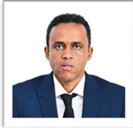
Mhe. Hussein Mohammed Bashe (Mb) Waziri wa Kilimo