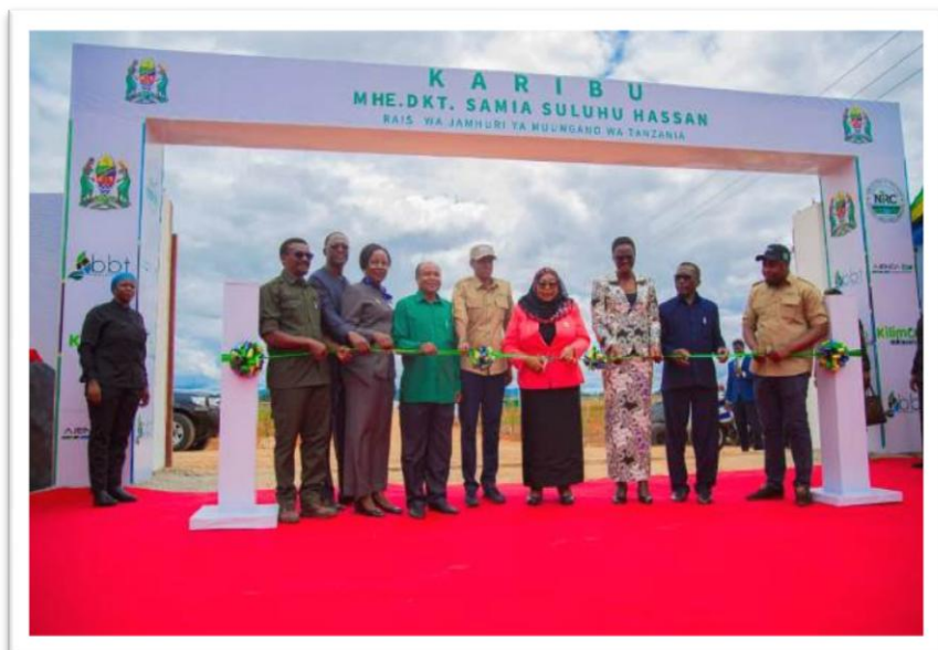
Picha Na.16: Rais wa Jamhuri ya Muungano wa Tanzania Mhe. Dkt. Samia Suluhu Hassan akizindua Mpango wa Kilimo cha Mashamba Makubwa ya Pamoja Chinangali - Dodoma

173. Hadi kufikia Aprili, 2023 ekari 264,841.5 za mashamba makubwa ya pamoja katika Mikoa ya Kigoma, Mbeya, Njombe, Singida, Dodoma na Kagera zimepimwa na kuwekwa mawe ya upimaji kwa ajili ya kuyapatia hati miliki ili yatumike katika utekelezaji wa program hiyo. Aidha, mashamba yaliyoainishwa yatagawiwa kwa vijana waliochaguliwa na kupatiwa mafunzo ya kilimo biashara.