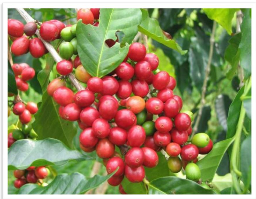
Picha Na.20: Zao la kahawa likiwa shambani

197. Mheshimiwa Spika , Bodi imesambaza mizani za kidigitali 300 katika vituo vya kuuza kahawa katika Mkoa wa Kagera na ukarabati wa ghala 50 umefanyika. Vilevile, hadi Aprili, 2023 jumla ya miche bora ya kahawa 8,894,120 imezalishwa ambapo Arabika ni miche 5,169,858 na Robusta ni miche 3,724,262. Kati ya miche iliyozalishwa miche 5,977,868 imesambazwa kwa wakulima na usambazaji unaendelea.